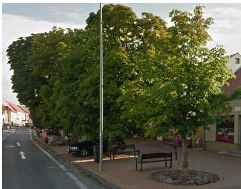
DOPLNENÉ STROMY NA HLAVNEJ ULICI