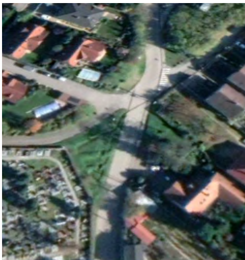
SÚBEH ULÍC PRI STAROM CINTORÍNE POSKYTUJE DOSŤ PLÔCH PRE VÝSADBU, LAVIČKU A PODOBNE

Ide o drobné verejné priestory, zväčša na križovaniach ulíc, ktoré v sebe nesú určitú osobitosť a pomáhajú orientovať sa v meste. Zväčša svojím pôdorysným usporiadaním poskytujú okrem plôch ulíc akési „zvyškové“ priestory, ktoré by mohli byť stvárnené podľa želania obyvateľov najbližšieho okolia, ktorí by mali niesť aj hlavnú rolu pri návrhu realizácii aj údržbe týchto priestorov. Záleží na tej, ktorej komunite, ako také miesto bude vyzerieť. Už dnes sú niektoré upravené, niekto niekde vysadil kvety, niekde je lavička, niekde je strom .... Často ide o miesta, ktoré mali aj v minulosti svoj význam, sú tu napríklad umiestnené božie muky alebo kaplnka.