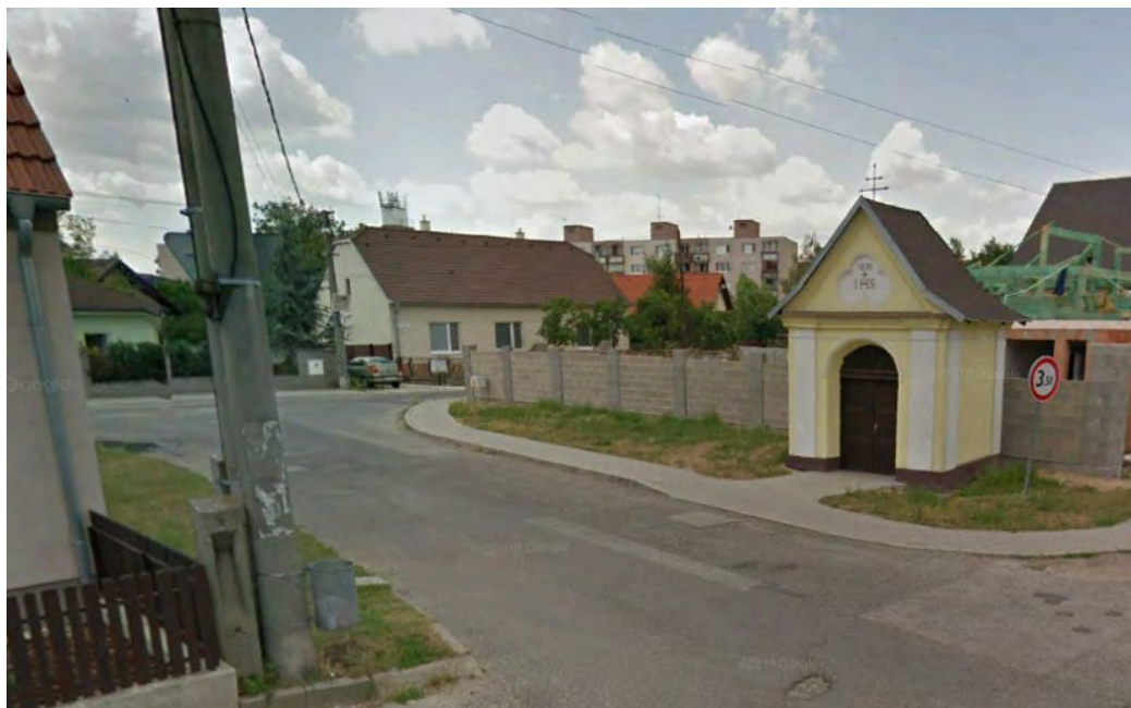
PREPOJENIE ULÍC DRUŽSTEVNÁ A FERDIŠA KOSTKU – OKOLIE KAPLNKY BY SI ZASLÚŽILO DOTVORENIE, PREKRYTIE BETÓNOVÉHO PLOTA POPÍNAVOU ZELEŇOU BY ZJEMNILO VZNIKNUTÝ KONTRAST