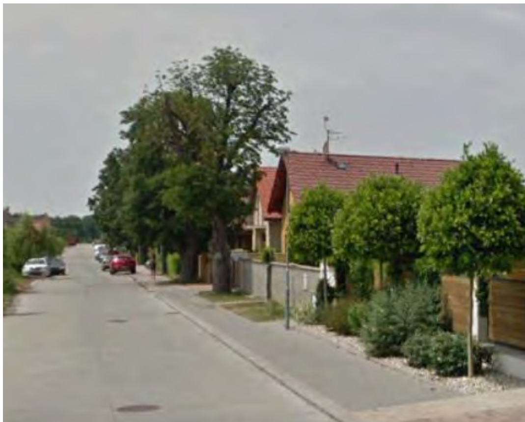
ULICA NA ALEJI – NEKONCEPČNÁ VÝSADBA NOVÝCH STROMOV