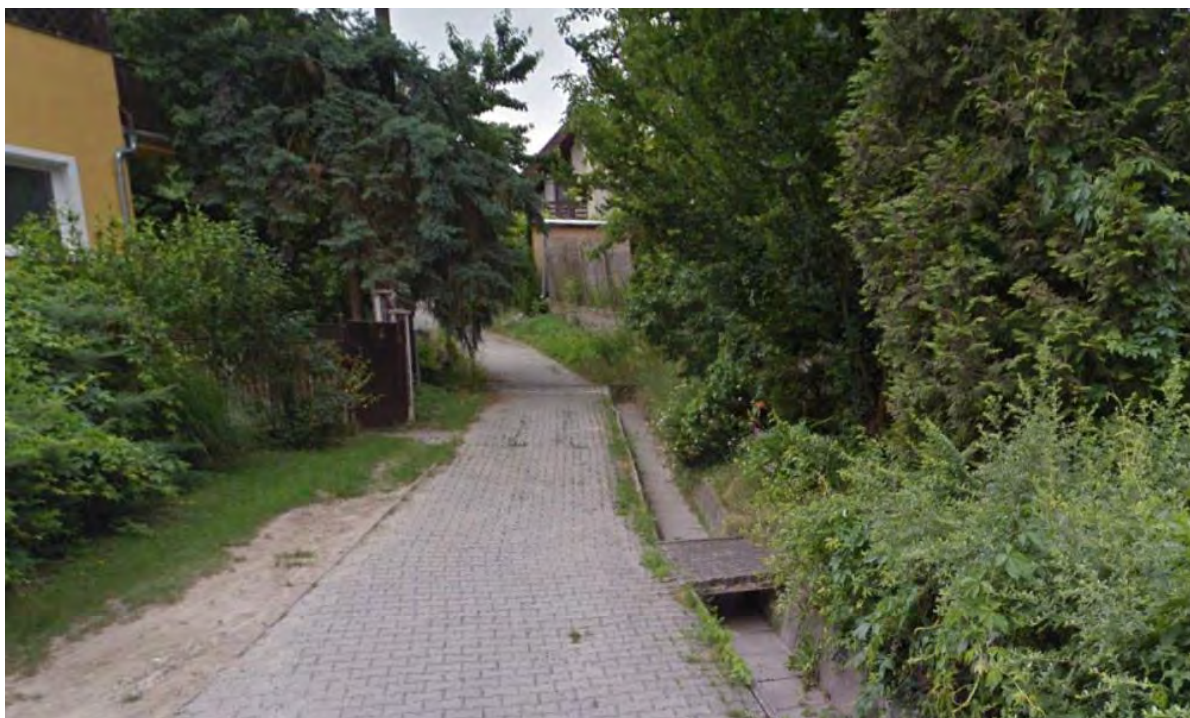
PREPOJENIE ULÍC KALVÁRSKA A SLOVENSKÁ – PRAVIDELNOSŤ A GEOMETRICKOSŤ ZÁMKOVEJ DLAŽBY SA DOSTÁVA VO VÝSLEDNOM PÔSOBNÍ DO KONFLIKTU S ORGANICKÝMI TVARMÍ ULIČKY