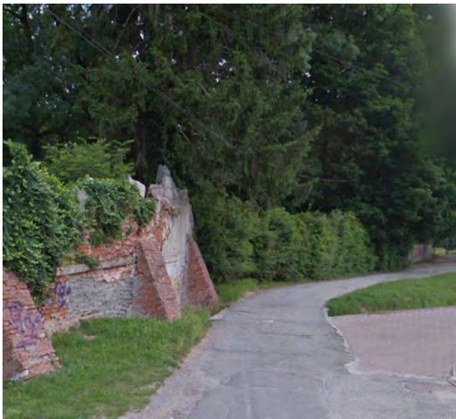
SLOVENSKÁ ULICA – PRÍKLAD JEDINEČNEJ ULIČKY S ROMANTICKÝM NÁDYCHOM