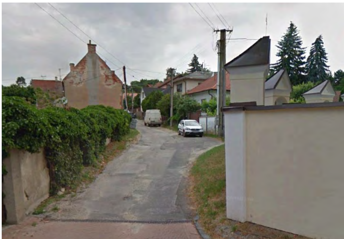
KALVÁRSKA ULICA – NEORGANIZOVANÁ POPÍNAVÁ ZELEŇ A TRÁVNATÝ SVAH SÚ V MODERNE RIEŠENÝCH VEREJNÝCH PRIESTOROCH NEZOPAKOVATEĽNÉ