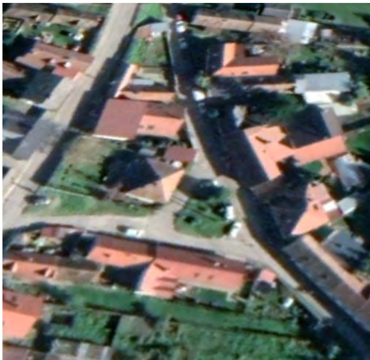
DUKLIANSKA ULICA – MALÉ NÁMESTÍČKO, KTORÉ BY MOHLO OBYVATEĽOM Z OKOLIA SLŮŽIŤ AKO „VONKAJŠIA OBÝVAČKA“