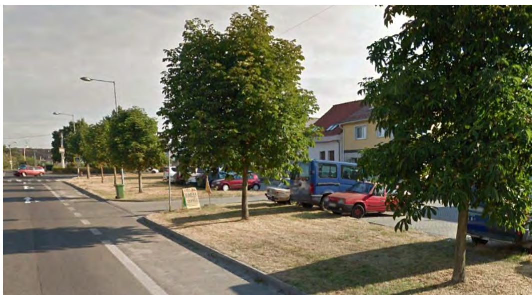
NOVOZALOŽENÁ ALEJA – HLAVNÁ ULICA