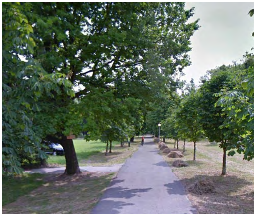
OBNOVOVANÁ ALEJA V PARKU